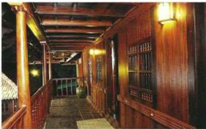
പൂർണ്ണമായും മരത്തിൽ തീർത്തിരിക്കുന്ന ആയുർവേദ സ്പാ