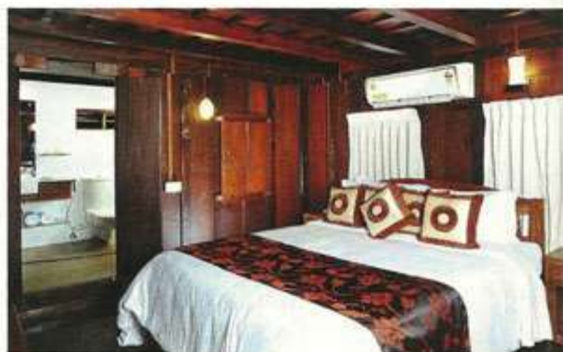
ആയുർവേദ സ്പായുടെ മുകളിലത്തെ നിലയിലെ ബെഡറൂമുകളിലൊന്ന്

മഴവെള്ളം ഒരു തുള്ളി പോലും നഷ്ടമാകാതെ ഉപയോഗിക്കാൻ 2.5 ലക്ഷം സംരേണ ശേഷിയുള്ള അണ്ടർ ഗ്രൗണ്ട് ടാങ്ക് പാൻട്രി കിച്ചന്റെ അടിയിൽ തയ്യാറാക്കിയിട്ടുണ്ട്. സിമ്മിൻപുൾ, ഗാർഡൻ, ടോയ് ലെറ്റ് എന്നിവിടങ്ങളിൽ മഴവെള്ളമാണ് ഉപയോഗപ്പെടുത്തിയിരിക്കുന്നത്. ചുടു വെള്ളത്തിനും പുറത്തെ ലൈറ്റി